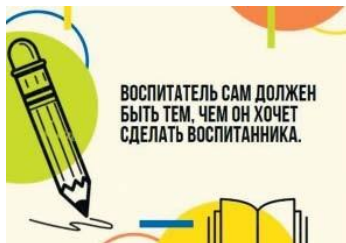
Рис. П2.2. Пример карточки с цитатой