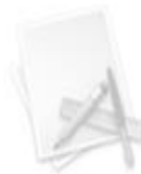
Состав и номенклатура кислот