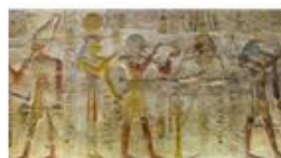
Тематическое занятие. ТРИ СКАЗКИ