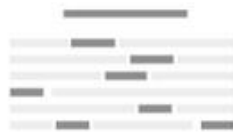
Сказка о царе салтане