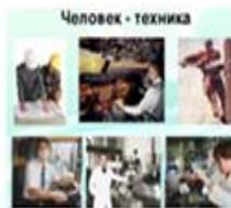
Распредели профессии по