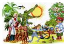
Сказки дедушки Корнея