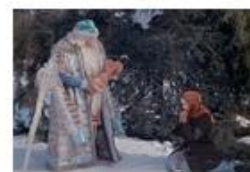
Сказки, вы откуда ?