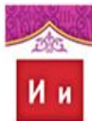
Макъзу И_ Адыгэ Мэкъэлпч Чэф